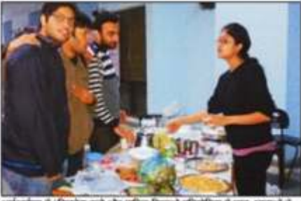
अर्थअर्थाएम में 'बिजनेस करो और प्राफिट दिखाओ प्रतियोगिता में छात्र-छात्राओं स्टॉल लगाए और अपने हुनर से की आमदनी। • शिन्दुरतान

राजवंशी ने वहां आईआईएए के उपने से भी इसी आईट्या पर बिजनेंस पत्तन तथार करने की अगोल की। उन्होंने मैंन नमेंट उपने से अगोल की। उन्होंने मैंन नमेंट उपने से अगोल की कि वे पैसे के पीड़े भारते के बजाए एक स्वात किसी आयोग इलाके में बिजाएं और बात पर बिजनेंस का कोई स्तीत खोजें। इससे वे देशा के लोगों के लिए कुछ