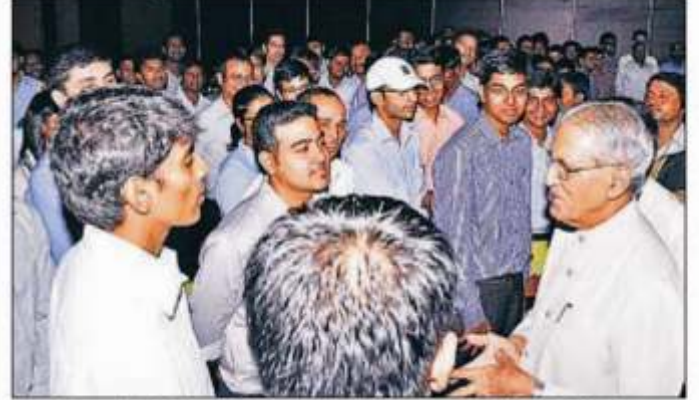
अईअईरम लखनऊ के नए सह के पहले दिन साही का उत्साह बढ़ाने के लिए राज्यपल बेएल जोशी भी मौजूद रहे । • इन्द्रालन

Name of the Publication : Hindustan Edition : Lucknow : 19/6/2013 Date