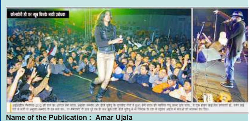
Lucknow : 22/1/12

Name of the Publication : Rashtriya Sahara Edition Date