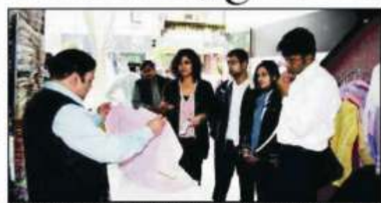
IIM-L students interacting with a chikan garment shopkeeper in Janpath Market in the city on Saturday

Name of the Publication : Amar Ujala Edition : Lucknow Date : 23/1/12