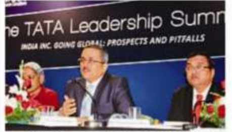
शुक्रवार को आईआईएम लखनऊ के वर्षिक विजनेस कॉन्क्सेव मैनफेस्ट 2012 में टांटा लीवरणिय समिट में मुख्य सलाहकार नवंत कृष्णा ने भी आने विवार रखे

इंडिया के पूर्व हिस्टी मवर्नर श्वामला योपीनाव ने भी विभार व्यक्त किए। कार्यक्रम में दियोलाइट इंडिया के हेड मेराव गुफा ने कका कि भारत को करने नेजनल कंपनियां बेहतर प्रदर्शन कर रही है। अनुमवार्य पुटोंगी के जीडेटर दन चीफ मेर्विन्टराव इस्टितन ने भी स्वर्थ का उध्म स्थापित कर उनने बढ़ने की नसीहत थे। इसके बाद शाम को स्पीक्रपेक की ओह मा आयोजित पॉडल रोज मु मनुमदार बजे प्रस्तृति ने सन्ते भाषी प्रयोधकों को भाग-विधीर कर दिया।