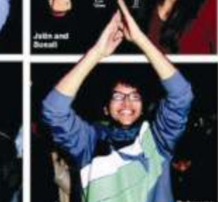
Name of the Publication : Rashtriya Sahara Edition : Lucknow Date : 23/1/12

गोमतीनगर फन माल के सामने आईआईएम दौड़ में भाग लेते प्रतिभागी।